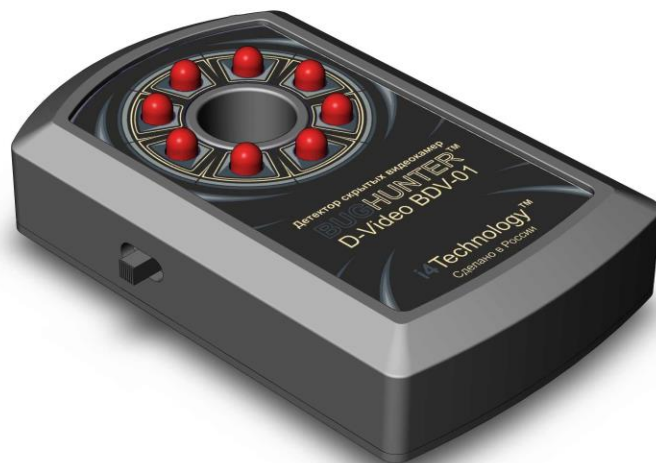
Рисунок 1 – внешний вид изделия